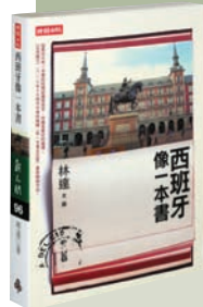
書名：西班牙像一本書 作者：林達 出版：時報文化(台北市和平西路三段240號3樓) 頁數：509 定價：新台幣450元

作者是著名的預測大師，從事過工、農、商、兵、黨、政、軍各項工作，在書中講解學習易占的基礎知識，毫無保留地奉獻自己迅速掌握易占技巧的訣竅，讀者從中可學到邵氏斷卦神技精奧之處。本書成稿後，由作者親自審訂，全部卦例皆為最實用的典範，初學者細心研習，必定獲益匪淺。