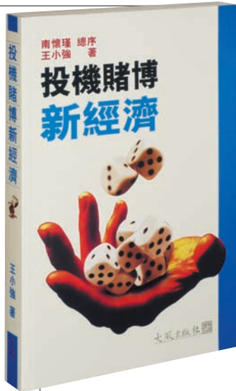
書名：投機賭博新經濟 作者：王小強 出版：大風出版社(香港灣 扶林置富道11號3樓a座) 頁數：373 定價：港幣88元

是 我不明白，還是這個世界變得也太快？十幾年前流行的老歌，成為當下世界與中國的切貼寫照。