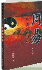
書名：周易預測例題解 作者：邵偉華 出版：明報出版社(香港柴灣嘉業街18號明報工業中心A座15樓) 頁數：326 定價：港幣七十八元

本書全面分析文化巨人魯迅，觀點新穎、分析精闢，具有相當藝術價值，充分體現現代學術主流意識形態與學術思想。全書分「為天地立心」、「神思之心和學之心」、「心生而言立」、「言立而文明」、「自由」的思想與自由「地」思想、「反抗」被描寫」六部分。