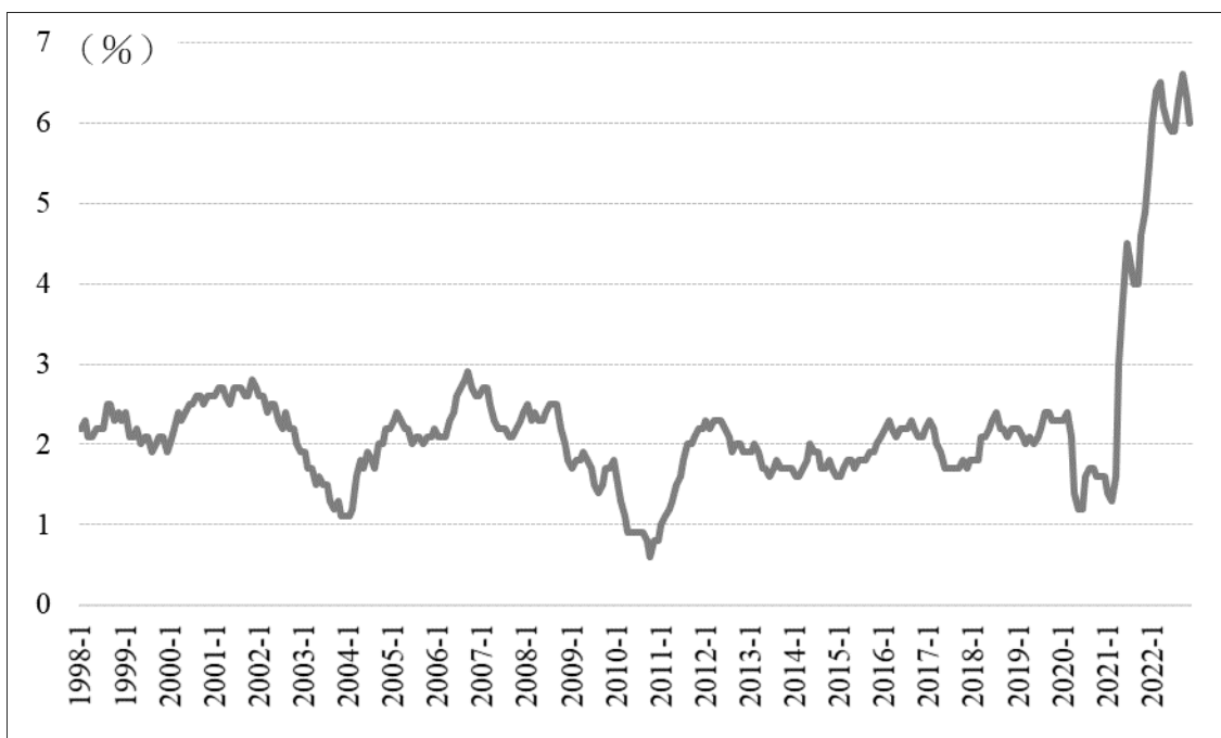
圖~1：美國核心通脹率，1998年1月~2022年11月 8 (單位：%)

放眼世界。疫情集中打擊勞動密集型產業，再加上美國為首堅持不懈對中國繼續“貿易戰”關稅推高進口成本、抬昇普羅大眾日常消費物價，北約東擴挑動俄烏戰爭~制裁俄羅斯推高國際油氣能源價格，〈 超出經濟範疇的經濟方案 〉， 6 終於帶來西方“期盼多年”的通貨膨脹。 7